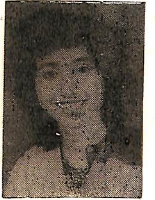
বন্তি বৰদলৈ। বছৰৰ শ্ৰেষ্ঠা গায়িকা।