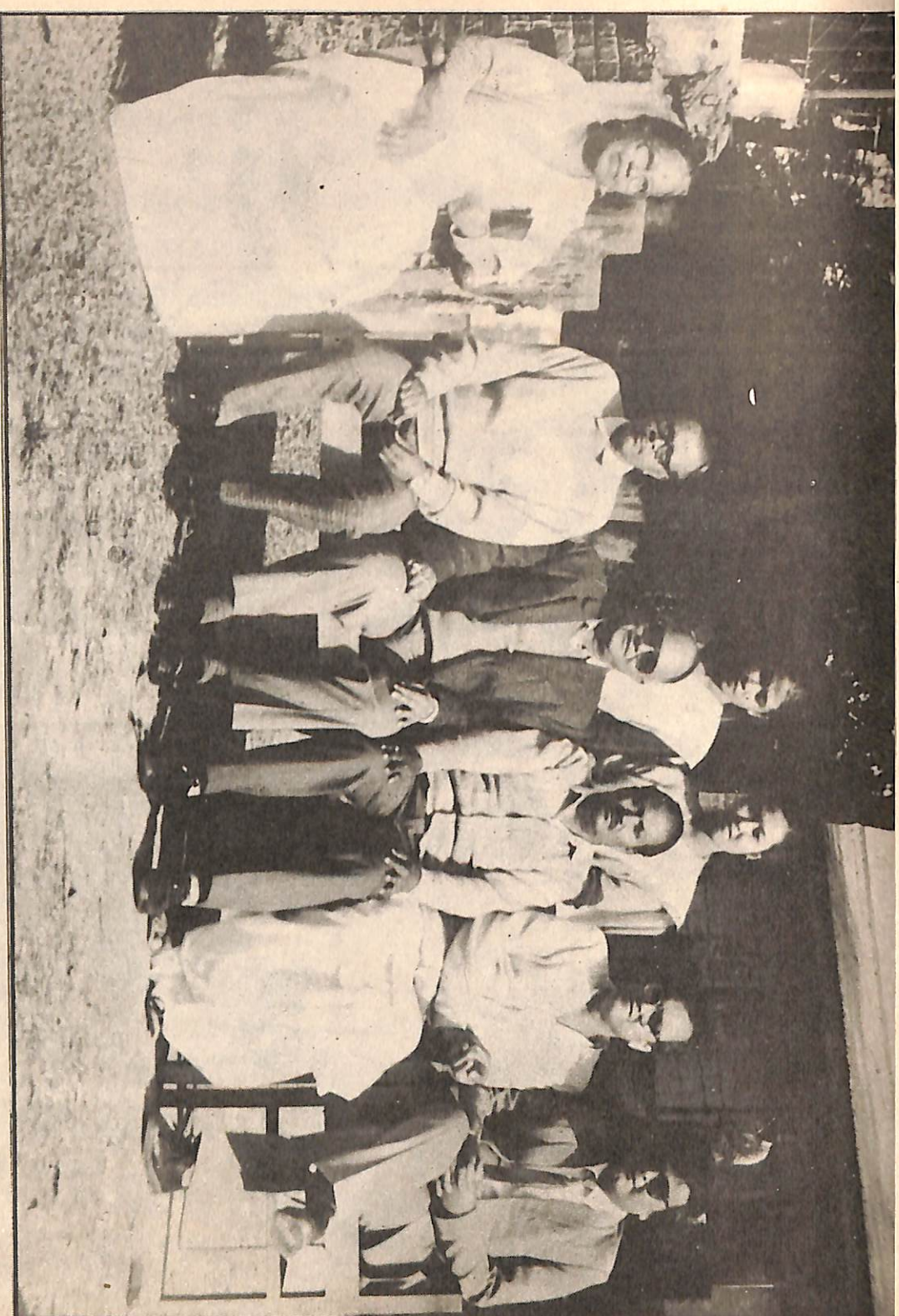
সম্পাদনা সমিতি ১৯৯০-৯১